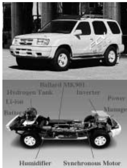
高圧水素方式燃料電池車「Xterra FCV」

「Xterra FCV」はネオジム磁石同期駆動モーターと小型高性能リチウムイオンバッテリーを搭載した高効率なハイブリッド方式の燃料電池車である。この技術は、当社「アルトラEV」、「ハイパーミニ」といった