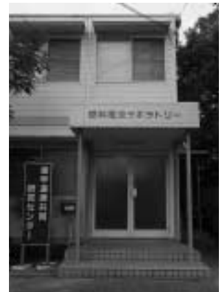
産学連携共同研究センター 燃料電池ラボラトリー