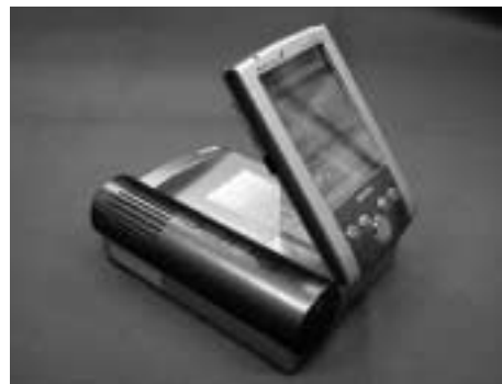
送液型のDMFCユニット(東芝)

が得にくい、ユニット形状としては薄い平面型の構造をとることもできるので、比較的出力の携帯電話などへの適用が考えられる。