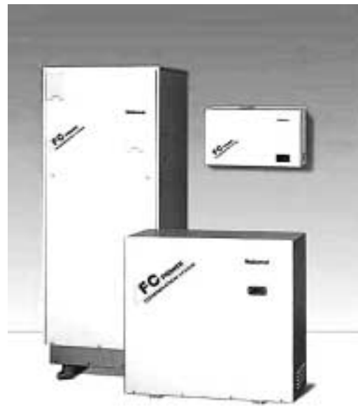
PEFCコージェネシステムの外観

今後は、さらに発電効率、総合効率の向上を図るとともに、起動性、負荷応答性、耐久性の向上等、実用性能を確保していく。また、システム各部の簡素化等による低コスト化への取組みを行っていく。