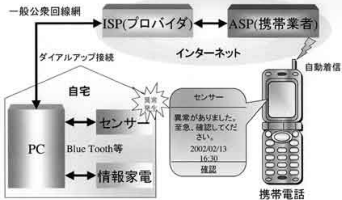
図1 「インターネットと携帯電話によるDIY型ホームセキュリティシステム」の概念図

提案のアイデアは、「家庭内に設置されたセンサーに異常が発生すると、PC(サーバ)はダイヤルアップしてプロバイダに接続すると共に、セキュリティ状態を現すWebをインターネット上に公開し、更にインターネット経由で予め登録された携帯電話に異常発生を通知する」ものです。携帯電話から自宅のWebを閲覧することによって利用者がどこにいても異常の内容を知ることが出来、適切な対処が可能になります。