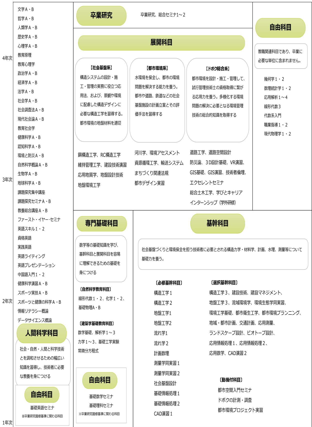
図一 建築学科都市空間インフラ専攻の教育課程の構成概念図