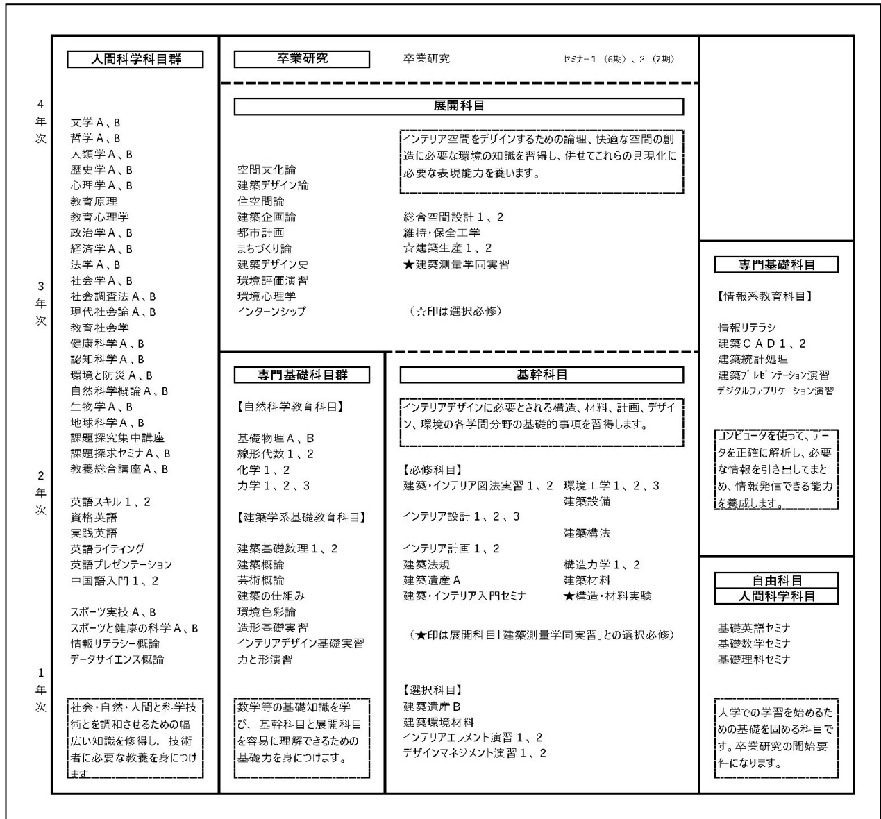
図-1 建築学科インテリアデザイン専攻の教育課程の構成概念図