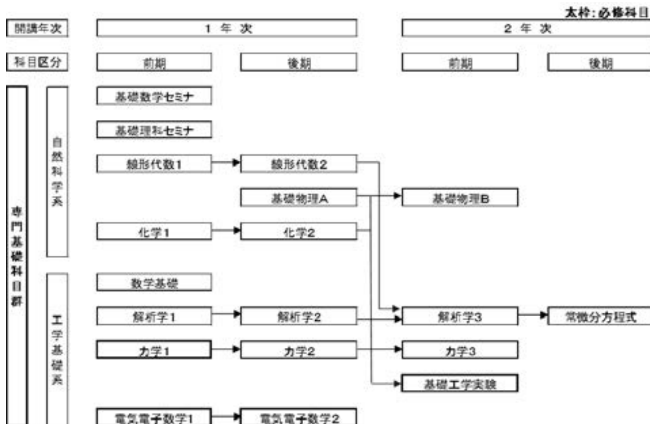
図-2 専門基礎科目群のカリキュラム・フローチャート

専門基礎科目群において学習する教育内容および学修到達目標について説明します。図-2のカリキュラム・フローチャートには、専門基礎科目群の授業科目のつながりとそれらの履修年度と学習順序が示してあります。